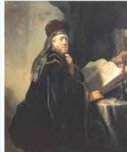
Título: "El Sabio en su Retiro"

Pero ¿cómo? una mujer que viaja sola, leyendo un libro. Seguramente procederá de la más alta alcurnia, tener un libro es caro, muy caro ¿eres rica?