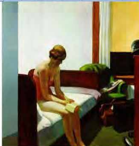
Título: "Hotel Room"